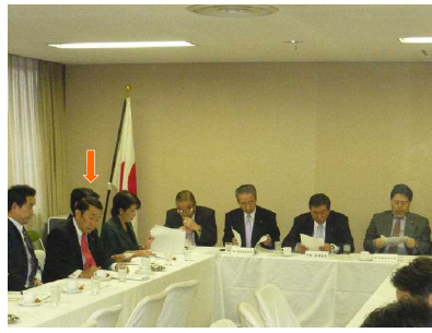
党再生会議・党政権政策委員会幹部メンバー