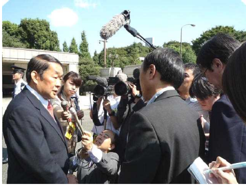
報道各社のインタビューに答える。