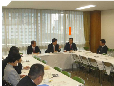
「政治主導」のあり方検証・検討プロジェクトチーム座長代理

衆議院では、 農林水産・内閣の各委員会委員を、 自民党では、 政務調査会副会長 東北ブロック両院議員会 幹事長代理 「政治主導」あり方検証・検討PT 座長代理を、 また、 日本海沿岸地帯振興促進議員連盟 党再生会議 党政権政策委員会 経済政策調査会 証券市場活性化議員連盟 山村振興特別委員会 農民の健康を創る会 水田農業振興議員連盟 生活衛生議員連盟 全国保育関係議員連盟 などの事務局長、幹事、世話人を務めております。