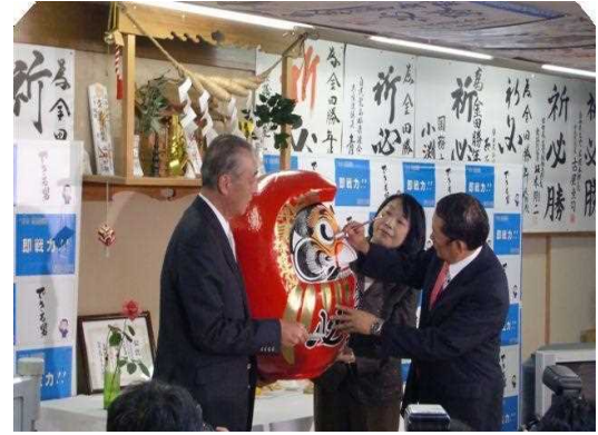
女房とともにだるまの目入れ。重さを実感。