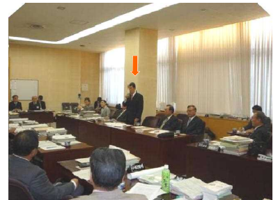
農相発言自民党調査団として(県議会控え室にて)

12月8日、赤松農林水産大臣は、秋田県を戸別所得補償制度から除外する可能性があると発言しました。まじめに苦勞して米づくりをし、生産調整方針に従った現場の農家を不安に陥らせるこの発言は許されるものではありません。自民党農林部会と秋田県連は、この発言を看過できないものとして、公開質問状を出すなどの対応をとりました。私は通常国会でしっかりとフォローし、秋田の農業を守っていくつもりです。