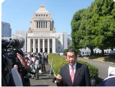
「さあ働けど!」秋田と日本のために決意は固く。