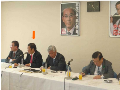
党山村振興特別委員会および党農民の健康を創る会事務局長