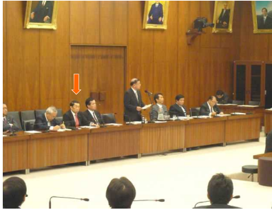
衆議院では農林水産委員会・内閣委員会に所属