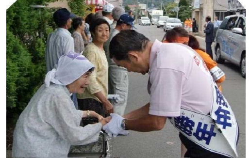
「この地域を守ります!」 お一人お一人の熱い思いに応えて。

2年ぶりに国会に登院した時は感無量ながら、野党という初めての立場に感慨にふける暇もなく、9月からは国会・党務・地元でフル活動の日々が続いています。