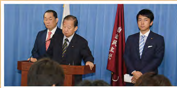
現在、幹事長代理として、政策、国会運営、党内人事等の仕事を。 党本部記者会見にて二階幹事長、小泉副幹事長とともに