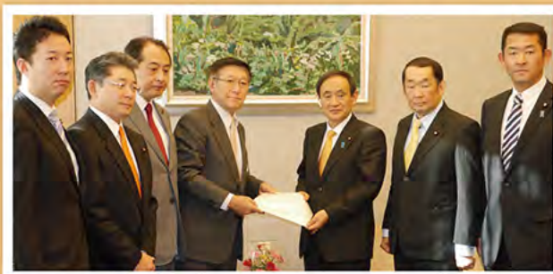
菅義偉内閣官房長官へ災害の要望