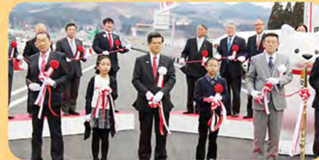
日治道の延伸や都市整備、河川改修などを次々に実現。