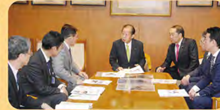
二階幹事長に、秋田の予算について説明。県知事の要望活動をリード。