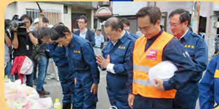
被災地を見舞い、早期の復興に向けて政府を指導し、減災防災・国土強靱化の予算を拡充。

自民党・幹事長代理として、総理、幹事長とともに、 災害対策や国会対応など、秋田と日本の課題の解決に力を尽くしています。