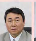
八郎潟町長 畠山 菊夫