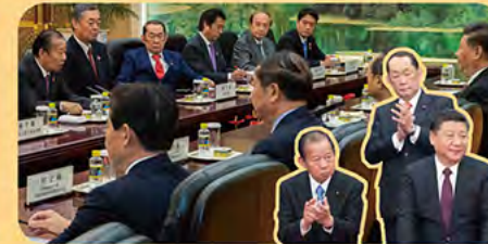
外交面でも、自民党を代表して、中国の習近平主席と会談。