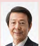
北秋田市長 津谷 永光