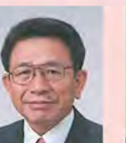
藤里町長 佐々木 文明