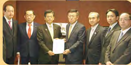
厚生労働、財務、国土交通、経済産業、農林水産、環境など各省大臣へ知事と予算の要望(写真は国土交通大臣)

地元から寄せられるあらゆる要望を、 国の責任者にしっかりと伝え、その実現に向けて取り組んでいます。