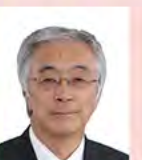
男鹿市長 菅原 広二