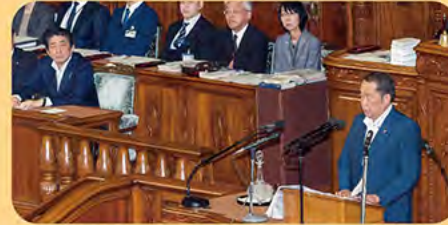
野党提出の内閣不信任案に対して、与党を代表し、衆議院本会議場で反対演説。