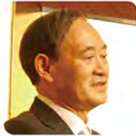
自民党幹事長 二階 俊博