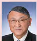
鹿角市長 児玉 一