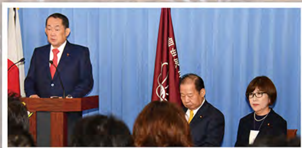
幹事長代理として、政策、国会運営に取り組む (写真は党本部での記者会見で、二階幹事長と稲田副幹事長とともに)