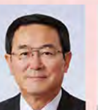
五城目町長 渡邊 彦兵衛