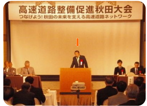
高速道路建設促進大会 日沿道などの早期全線開通を目指して