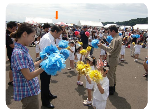
のしろみなと祭り

各地のお祭りやイベントにも積極的に参加しています。皆さんお気軽に声をかけて下さい！