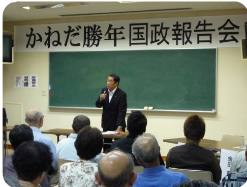
週末は必ず地元に戻り各地で国政報告会 政治の信頼回復のため 一人一人に丁寧に語ります