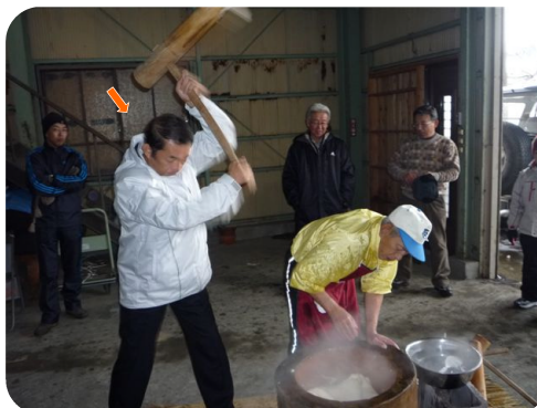
地元自治会のもちつき大会