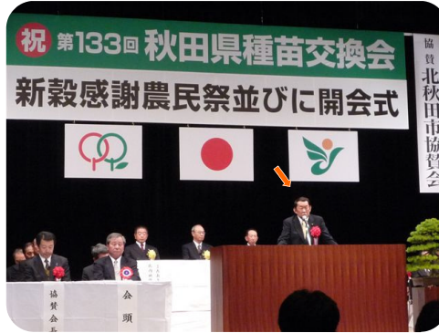
農業の祭典 県種苗交換会で挨拶