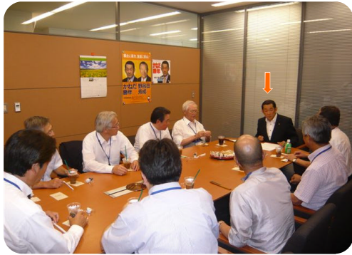
新しくなった議員会館で 地元陳情団の皆さんをお迎えして